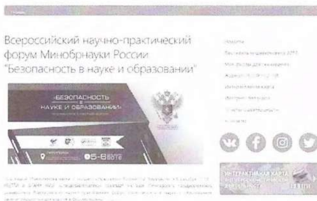
Рисунок 2 – Краткий пресс-релиз

Краткий пресс-релиз обычно содержит информацию с приглашением посетить мероприятие, зарегистрироваться или получить аккредитацию для представителей СМИ. Пример размещенного пресс-релиза продемонстрирован на рисунке 2.