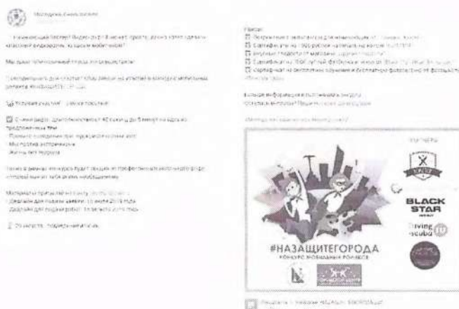
Рисунок 1 – Анонс мероприятия в социальной сети

В анонсе должна содержаться информация, разъясняющая что, где, когда и кем проводится. Данные могут предоставляться дозированно, обязательный элемент – наличие прямых контактов организаторов (см. рисунок 1).