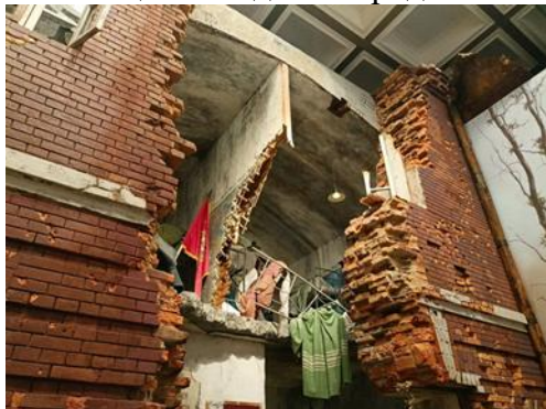
Музею Победы, которая показывает героический путь

В первый же день с самого утра мы отправились на грандиозную экспозицию "Подвиг Народа" в