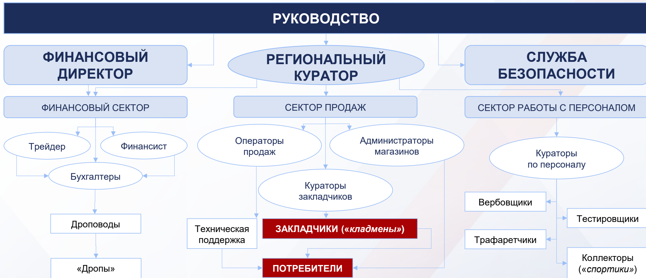
СХЕМА ПРЕСТУПНОЙ ОРГАНИЗАЦИИ, РАСПРОСТРАНЯЮЩЕЙ НАРКОТИКИ